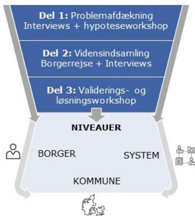
Figur 1: Analysedesign

Endelig er der afholdt enkelte møder med repræsentanter fra Ankestyrelsen, Socialstyrelsen og Klinisk Funktion med et formål, at indhente deres viden og perspektiver på de problemstillinger som Jobcentrene peger på. Viden herfra er alene blevet anvendt til arbejdsgruppens baggrund og citeres derfor ikke direkte i rapporten.